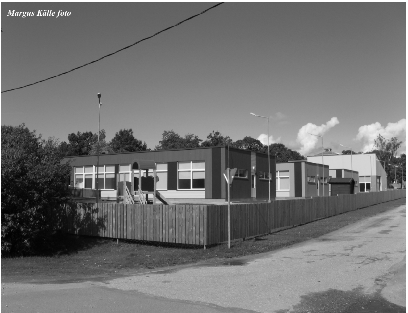
Lihula uus lasteaed

raamatukogud, samas on kõik varasemad laenutuspunktid alles. Kulude optimeerimiseks moodustati Lihula Kultuurikeskus, kuhu ühendati Lihula Kultuurimaja, Lihula Muuseum, Noortemaja ja kogu Linnusemäe haldamine. Sama eesmärgi teenib osaihingute Lihula Soojus ja Lihula Vesi eesseisev ühendamine.